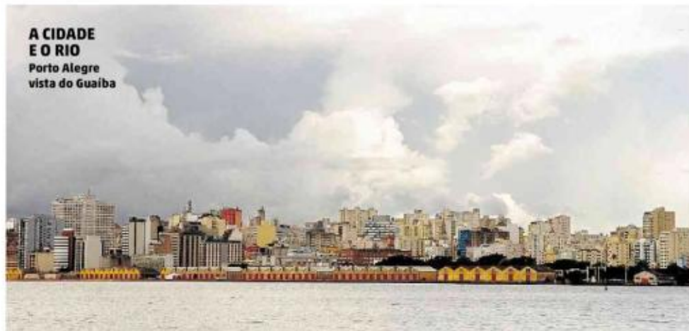
A CIDADE E O RIO Porto Alegre vista do Guaíba

Cada cidade é uma cidade e tem as suas especificidades. Não teria coragem de dar uma tábua rasa, mas algumas coisas são comuns. O cidadão reclama da mobilidade e do transporte. Está certo: é onde a política pública está muito mal.